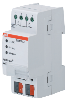
ABB i-bus® KNX Diagnose- und Schutzmodul, REG DSM/S 1.1, 2CDG 110 060 R0011

Das Diagnose- und Schutzmodul ermöglicht eine schnelle Diagnose des Buszustandes und zeigt Telegrammverkehr über eine LED an. Über den Wechselkontakt kann ein Busausfall ( U < U_{\min} ) gemeldet werden. Das DSM enthält außerdem eine Suppressordiode, die kurzzeitige Überspannungen und Störspannungsspitzen auf dem KNX kappt.